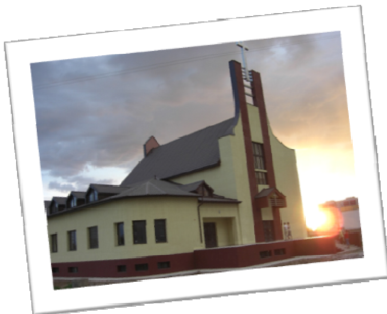
Kostol Panny Márie Ustavičnej Pomoci v Uralsku (Kazachstan)

Zaujímavé je i pútnické miesto v severnom Kazachstane - Ozjornoje, farnosť Kráľovnej pokoja, kde