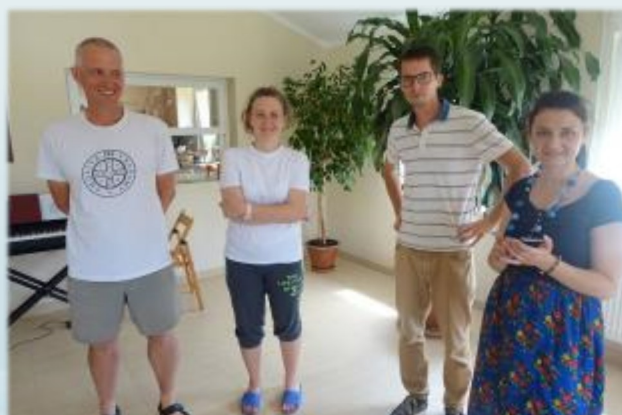
Pripravilo Svetlo Máriino